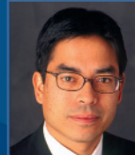
Dan C. Chung

ISIN Nummer: LU0242100229 (A-Anteile) Portfolio-Manager: